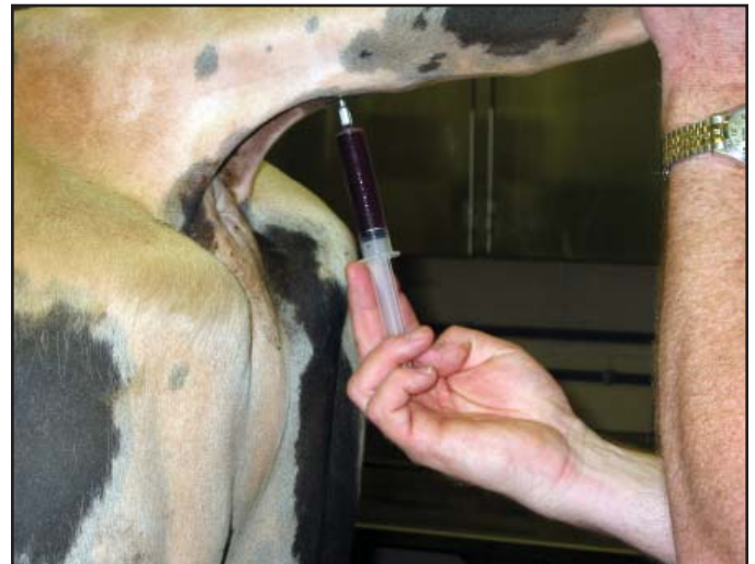
El toro promedio en una de las mayores centrales de IA puede recibir mas de 30 pruebas sanitarias en un año, mientras se controlan 12 o más enfermedades.