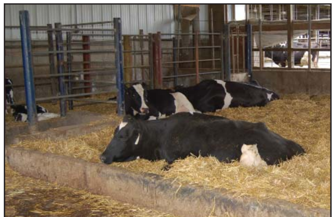
Es crítico tener áreas para aislar animales enfermos o recién adquiridos del resto del hato.