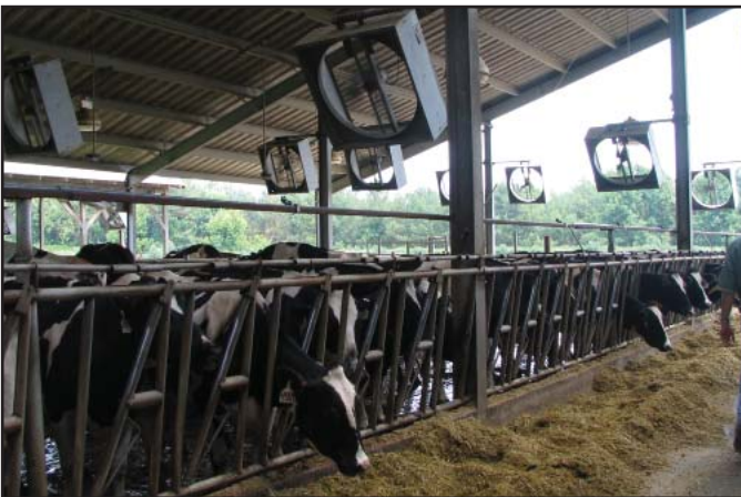
Durante los meses cálidos y húmedos los abanicos y los atomizadores proveen comodidad adicional.

Es muy fácil detallar 60 a 80 razones diferentes que pueden afectar el éxito de una determinada inseminación, muchos de ellos ocurrieron varios meses antes de la fecha de inseminación. Los gerentes más exitosos reconocen que cada día debe ser usado para preparar la vaca para una mayor fertilidad en el futuro. El componente más fácil de controlar en la cadena de la fertilidad es la calidad del semen. Solo se debe comprar semen de centros de IA de buena reputación, aprobados por CSS, y asegurarse que los inseminadores estén adecuadamente entrenados. El programa de detección de celos debe minimizar el número de vacas que sin estar en celo son presentadas a ser inseminadas. Trabaje en conjunto con el veterinario, el nutricionista y el especialista en Soluciones Reproductivas de Select Sires para establecer un programa comprensivo de manejo de hato que asegure que todos los componentes de la cadena de fertilidad estén considerados. ♦