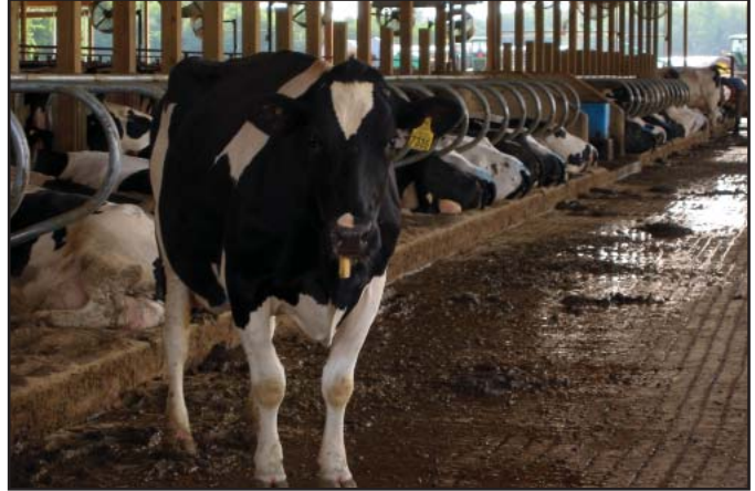
Los pasillos de concreto deben ser ranurados para evitar que los animales se resbalen.

La comodidad de las vacas es otro importante componente ambiental en la ecuación de fertilidad. Las vacas definitivamente tienen que estar cómodas frente al comedero y a la sombra; los abanicos y atomizadores son extremadamente importantes para este fin. Hay que prestar especial atención al tamaño de las galeras y la frecuencia del cambio de la cama. En echaderos comunales de tierra, hay que proveer montículos y