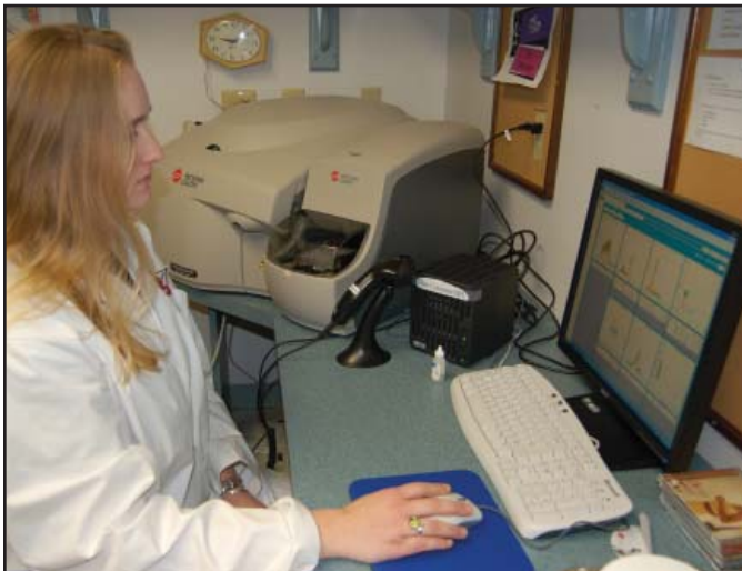
Los toros residentes en las mayores centrales de IA pasan por críticos escrutinios de calidad de semen en cada colección, usando la más alta tecnología disponible para la evaluación de semen.

para lograr niveles normales de concepción. Los toros residentes en las mayores centrales de IA pasan por críticos escrutinios de calidad de semen en cada colección, usando la más alta tecnología disponible para la evaluación de semen. Los eyaculados de calidad inferior son inmediatamente descartados. Los toros que continúan produciendo eyaculados de baja calidad, quizás debido a enfermedades o condiciones climáticas adversas, pueden ser temporalmente removidos del programa de colección. Algunos toros simplemente son descartados del programa. Estos procedimientos aseguran que solo el semen de alta fertilidad es el que sale al mercado. Como resultado de estos procedimientos de control de calidad del semen, la variación en la tasa de concepción entre toros es extremadamente pequeña. A como ha sido estimado tanto por Agritech Analytics y el Laboratorio de Programas de Mejora Animal del Departamento