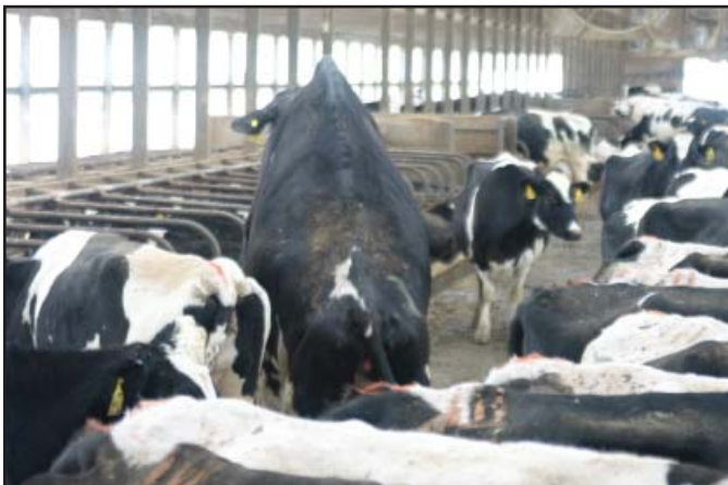
Los inseminadores deben ser capaces de identificar precisamente a las vacas que realmente estén en celo.

La exposición a enfermedades ambientales puede impactar dramáticamente el desempeño reproductivo. Muchos son los hatos que han descubierto que los programas de vacunación son solo pólizas de seguros pero de ninguna manera son una garantía. Trabaje con el veterinario para establecer un programa rutinario de salud. Las vacunas deben ser combinadas con un buen programa de monitoreo y pruebas de enfermedades. Las pruebas son especialmente importantes en casos de