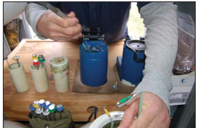
La higiene es un atributo subestimado de la eficiencia de un inseminador.