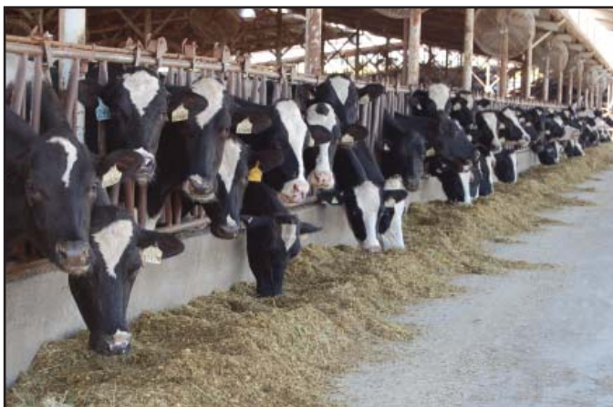
No hay un solo factor con una mayor incidencia sobre la fertilidad que la nutrición.

No existe un solo factor que afecte la fertilidad de la vaca más que la nutrición. Además, probablemente no exista un periodo en el ciclo reproductivo de la vaca donde su nutrición es más descuidada que durante la última parte de su lactancia. La incidencia de problemas en la vaca recién parida es altamente dependiente de la calidad del programa de transición. La calidad del programa de transición depende fuertemente de la cali-